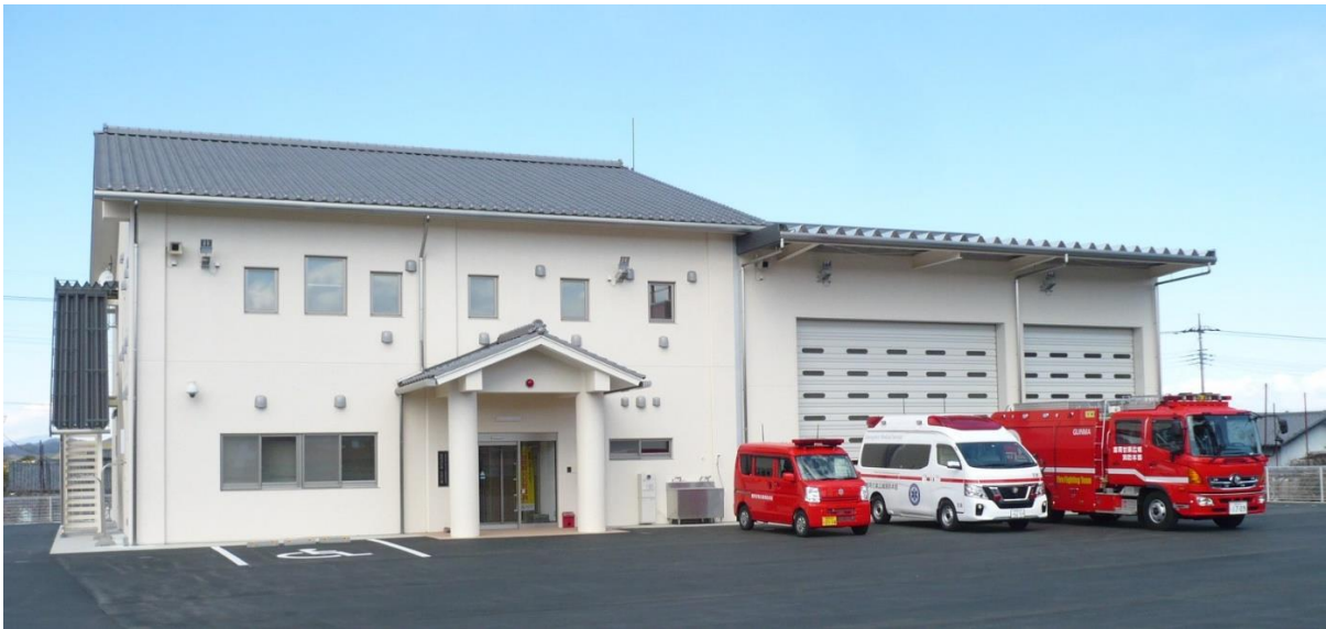
庁舎及び配備車両（令和 5 年 3 月 1 日現在）

富岡消防署甘楽分署は建設から 40 年以上経過し、庁舎及び設備等が著しく老朽化しておりました。この問題を解消するため移転を行い、現庁舎で令和 2 年 4 月から供用開始しております。