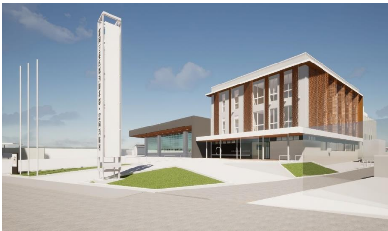
富岡甘楽広域消防本部・富岡消防署 完成イメージ（庁舎南面、東面） 図

工事中においては、工事車両の出入りに伴い、住民の皆さまには大変ご迷惑をおかけする事になりますが、ご理解ご協力のほど、よろしくお願いいたします。