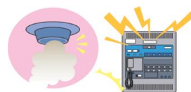
屋内消火栓設備 スプリンクラー設備 自動火災報知設備